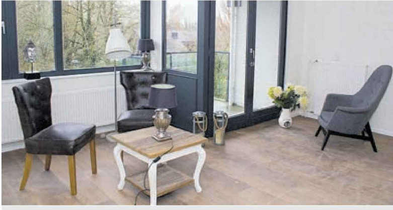
Een voorbeeld appartement afgewerkt voor de Open Dagen.