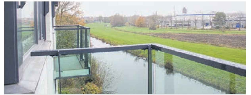
De balkonnetjes zijn van glas gemaakt, zodat ook vanuit een rolstoel van het uitzicht kan worden genoten.

De voormalige recreatieruimte van het gebouw zal na de verbouwing de multi-room worden. "Wij ervoeren deze plek als zo mistroostig. Iedereen zat daar maar een beetje, met weinig beweging. Daar willen we verandering in brengen. Er komt een tafelfoetbaltafel, een pooltafel en pingpongtafel en voor de kleinkinderen een hoekje met speelgoed en een PlayStation. Daar blijft het niet bij overigens. Het idee is dat deze ruimte heel flexibel zal worden ingericht met als doel dat het verschil-